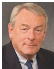
Richard W. Pound rpound@stikeman.com MONTRÉAL